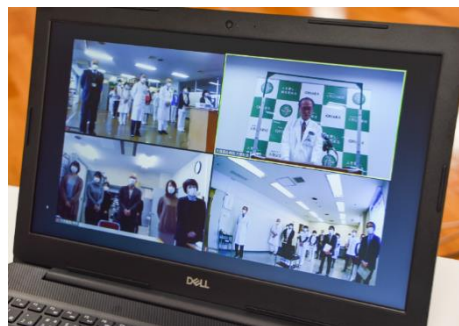
※写真左：ZOOM 仕事始め式の様子

者サービスの向上に努めて参ります。病病連携もオンラインでもっと便利にしていくため、着実に一步先を歩んでいきたいと考えておりますのでどうぞご期待ください！！