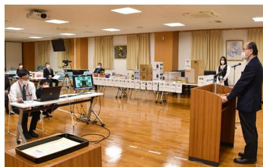
※写真右：財団新年会の様子